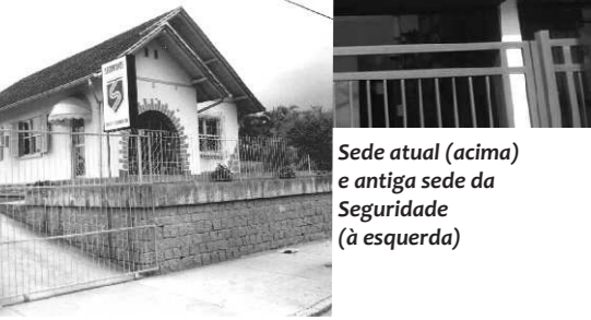
Sede atual (acima) e antiga sede da Seguridade (à esquerda)

Para o conhecimento dos funcionários sobre seu salário, desenvolvemos a planilha abaixo onde apresentamos o valor correspondente ao desconto de cada incidência sobre sua remuneração; ou seja, o valor que refletirá em seu orçamento familiar quando houver atestado, faltas ou alguma medida disciplinar dentro do período de apuração do cartão ponto: